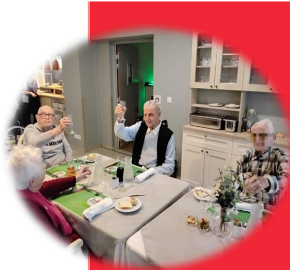
A la vôtre Messieurs !